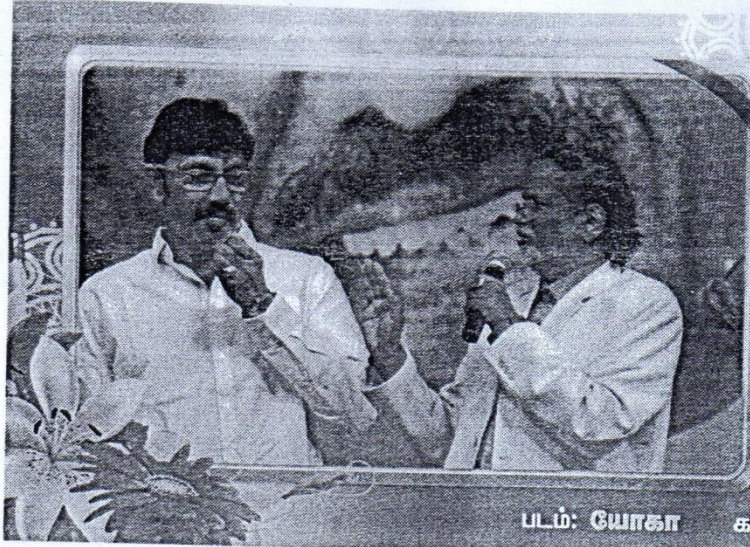
படம்: யோகா கமெண்ட்: ஜ்வாலா

எம் படத்துல நடிக்க இத்தனை யோசனையா? வாழப்பழ ஜோக்கெல்லாம் வைக்க மாட்டேன். நல்ல யூத் சப்ஜெக்ட்தாம்ப்பா!